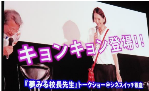
『夢みる校長先生』トークショー@シネスイッチ銀座

○自分が勤めている学校とはあまりにも違いすぎて、どうしてこんなに自分の学校に「夢」がないのだろうと感じた。でも実は「前例主義」に自分も飲み込まれていることに気付かされた。ありがとうございました。(小学校 60代)