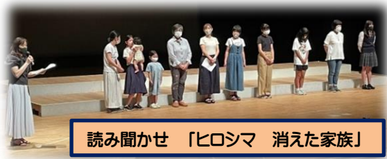
読み聞かせ 「ヒロシマ 消えた家族」

これまで参加されたことのない方は是非一度参加してみませんか。きっと、反戦・平和学習のヒントをたくさん見つけることができると思います。