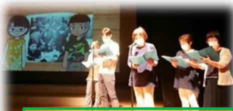
朗読劇「あなたにとっての平和とは」

今、これを読んでいる皆さんは、当然「無関心」ではないですよ。でも、皆さんの周りの人はどうですか？家族は、知人は、クラスの子どもたちは・・・どうですか。